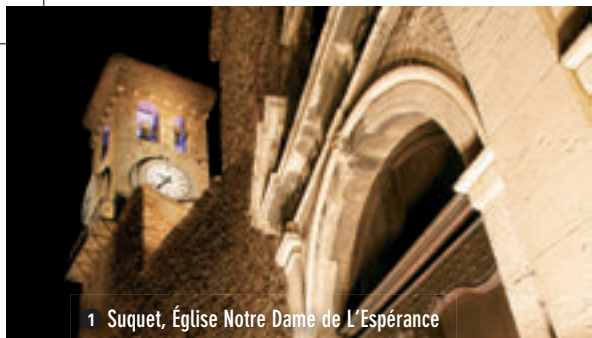
1 Suquet, Église Notre Dame de L'Espérance