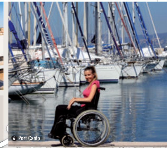
6 Port Canto