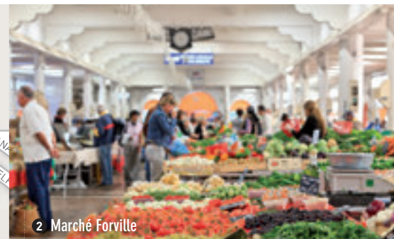
2 Marché Forville