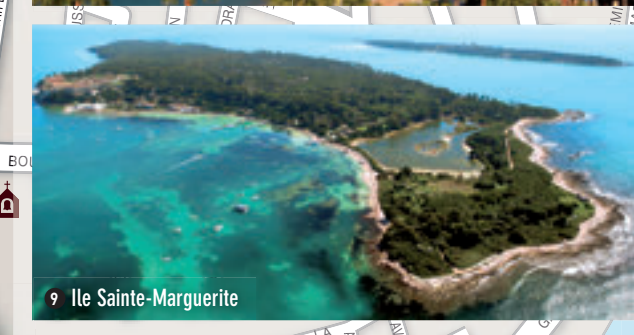
9 Ile Sainte-Marguerite