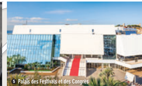
5 Palais des Festivals et des Congrès