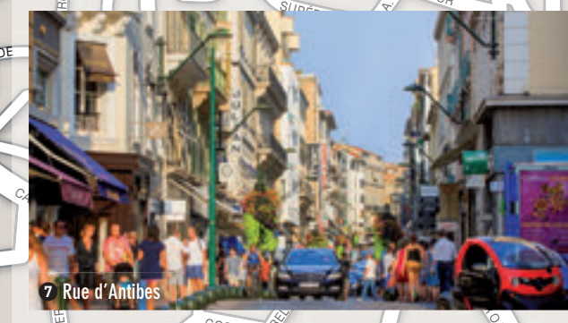
7 Rue d'Antibes