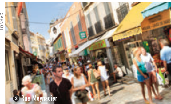
3 Rue Meynadier