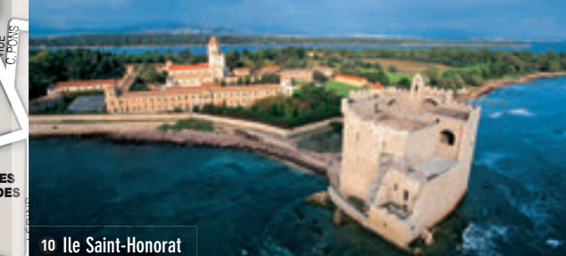
10 Ile Saint-Honorat